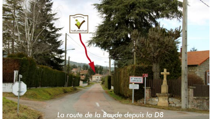
La route de la Baude depuis la D8

En venant de SAINT ETIENNE, prendre l'A72, puis l'A89 et sortie n° 32 : SAINT GERMAIN LAVAL